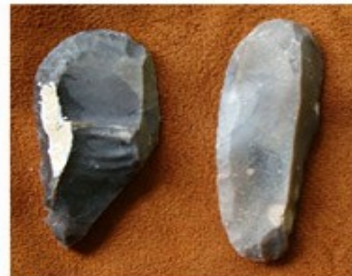
Grattoirs (reproductions de Florent Rivère)