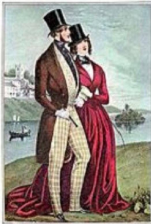
THE LOVERS. Painted by G. Kneller.